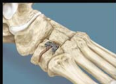
Cotton Osteotomie LPS Cotton Osteotomie Platte