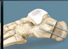
Kalkaneus Verschiebeosteotomie 6.7 mm LPS Schraube