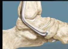
FHL Sehnentransfer Bio-Tenodese Schraube