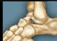
Subtalare Arthrorise ProStop Schraube