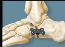
Evans Osteotomie H-Platte